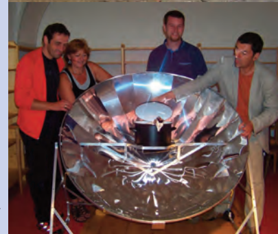
Good Practice: OTELO